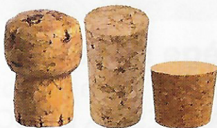
Tous les bouchons en liège