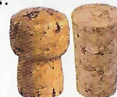
Bouchons en liège

Les bouchons en liège sont broyés pour être transformés en panneaux d'isolation acoustique et thermique pour les bâtiments et maisons, pour des revêtements de sols et de murs , et bien d'autres... Les bouchons en synthétique sont recyclés dans l'industrie plastique principalement en fibre textile .