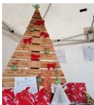
LE SAPIN SYMPA ET RESPONSABLE

De plusieurs ploggings (principe de ramasser les déchets en courant ou en marchant), d'une maison économe et écologique à la journée de la recyclerie, de stands lors du parking day ( http://www.parkingday.fr/ ), du carrefour des associations, du téléthon avec la vente de tissu pour réaliser des emballages cadeau en furoshiki pour un Noël plus responsable et des kits pour fabriquer son beewrap pour remplacer le film alimentaire en plastique, les recettes ayant été redistribuées à l'association Tel est ton combat ).