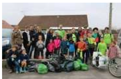
PARTICIPANTS AU PLOGGING ET LEUR « RÉSULTAT »

Le groupe zéro déchet très actif annonce déjà sa présence à la recyclerie le 28 mars , l'organisation d'autres ploggings ainsi que plein d'autres surprises.