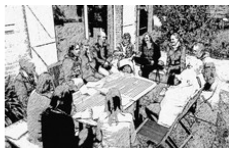
UNE RÉUNION DYNAMIQUE ET BUCOLIQUE

2020 commence avec autant d'enthousiasme, d'énergie renouvelable et d'idées qui fusent. Les différents groupes du collectif se préparent pour une année chargée, en actions et animations mais aussi et surtout pleine de bonne humeur et de joie partagée.